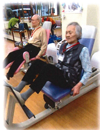
次回の体力測定にむけて 頑張ってます！