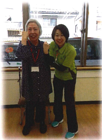
体力測定前に気合を入れて てガッツポーズ！！

あっという間に3ヶ月に1回の体力測定がきましたね 皆様いかがでしたでしょうか？ 1年前の体力測定用紙から新しい体力測定用紙に変わっていますが、「みやすくわかりやすくなった。」 「わかりずらくなった」などみなさまの意見をお待ちしております。