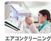
エアコンクリーニング