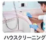
ハウスクリーニング