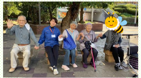
仲良くお散歩(休憩中)

天気が良かったので、向島の中央公園に屋外歩行に行きました。秋の空気と澄み渡る青空が心地よくて皆さんの歩数もどんどん増えていきました！！また春になったら桜を見に行きたいですね😊