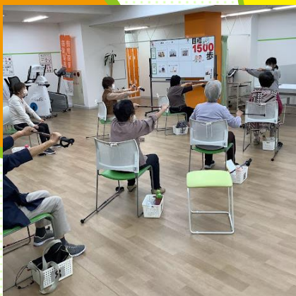
定番メニュー (ポール体操)

こんにちは◎ひかりサロン安心プラス向島、職員3人で向島祭りに参加してきました。サロンのお客様も多数見に来て頂きありがとうございました。ひかりサロンでは健康チェックの1つで体組成計を計測させていただきました。今年は去年よりも多くお客様が来られ、116名の方の体組成計を計測する事が出来ました。大変でしたが大成功に終わって良かったです。来年も楽しみにしています。