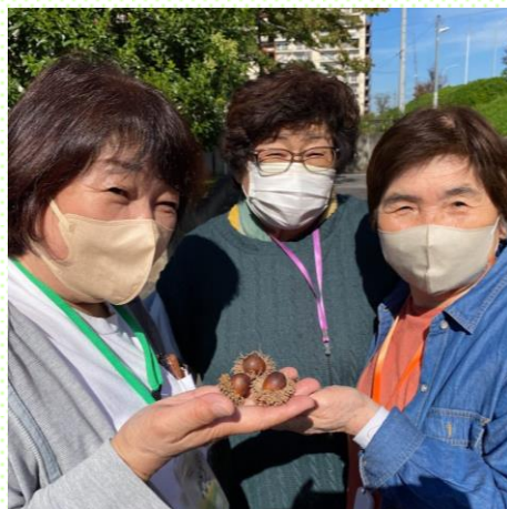
ドングリ三姉妹 (屋外歩行訓練)