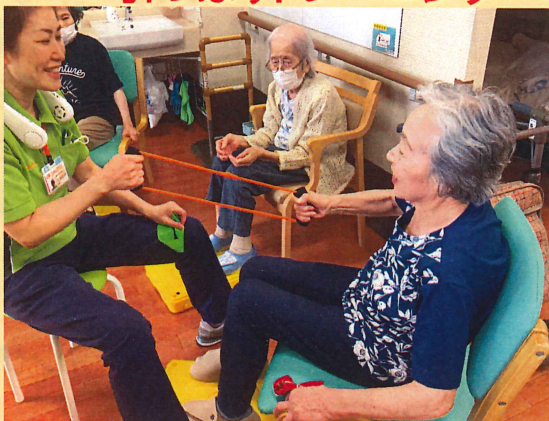
チューブを引いて物を持つ力をつけます。