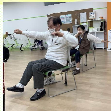
ワンツーパンチでお腹周り シェイプアップ