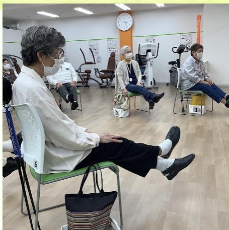
足クロスで筋力アップ！！