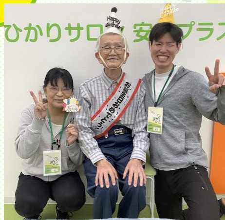
最高齢95歳おめでとう ございます