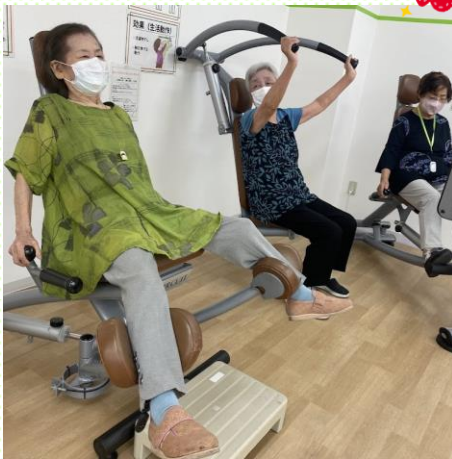
マシン運動 全身筋力アップ！！