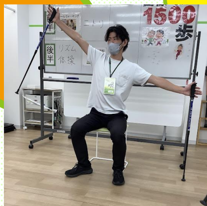
ポール体操 身体をストレッチ