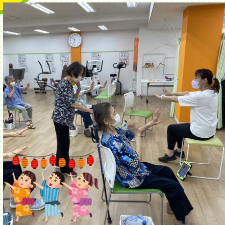
盆踊り(炭坑節) っあ～、よよいのよい