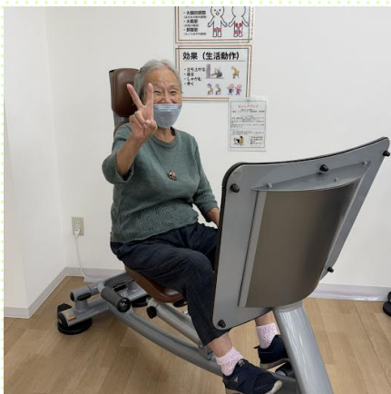
マシン運動 全身筋力アップ！！