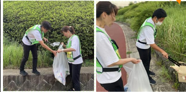
向島ニュータウン 6街区周りのゴミ拾いをしました。