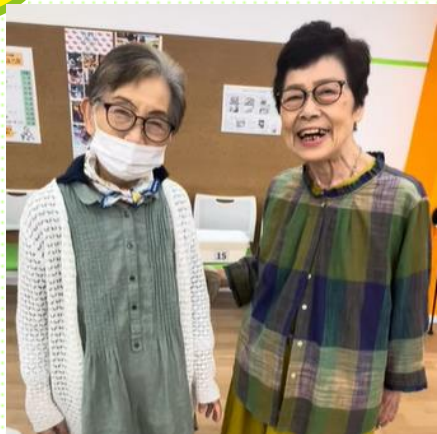
笑顔のツーショット